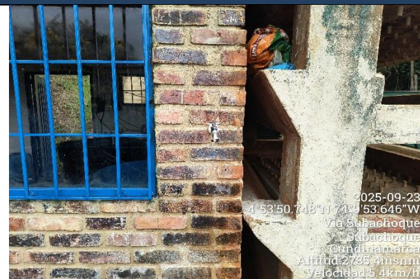
IMAGEN 5. PUNTO DE MONITOREO