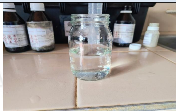
IMAGEN 8. MEDICIÓN IN SITU