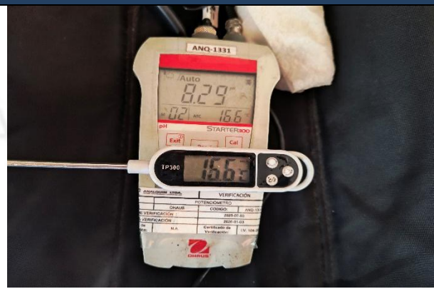
IMAGEN 6. MEDICIÓN IN SITU