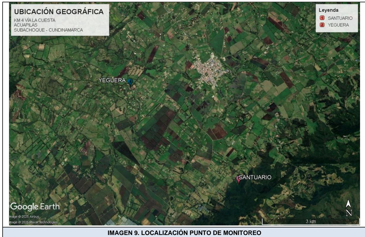
IMAGEN 9. LOCALIZACIÓN PUNTO DE MONITOREO